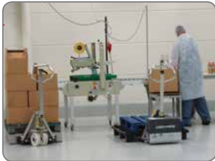
RF-PLUS - daar waar strenge eisen worden gesteld inzake hygiëne.