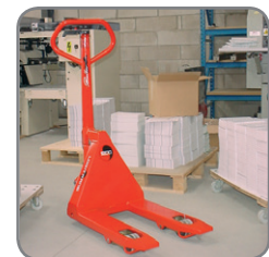
Verkrijgbaar in verschillende vorklengtes.

Wij bieden eveneens op maat gemaakte oplossingen. Vraag meer informatie, of bezoek www.logitrans.com