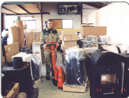
Gemakkelijk werken in gelijk welke enge ruimte verzekerd.