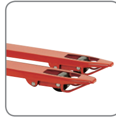
De beugels aan de vorkuiteinden garanderen een gemakkelijk inrijden en uitrijden van paletten.