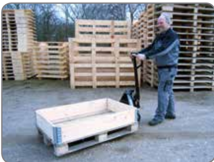
De Panther Silent kan ook buiten werken. Metaalresten, kleine stenen en sneeuw blijven niet aan de wielen kleven.