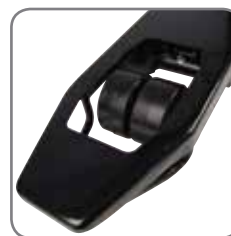
Dubbele wielen voor gemakkelijk veranderen van richting.