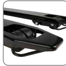
De beugels aan de vorken verzekeren een gemakkelijk in- en uitrijden van paletten.