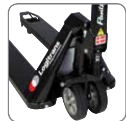
De Panther Silent is voorzien van een permanente quick lift.

Wij bieden eveneens op maat gemaakte oplossingen. Vraag meer informatie, of bezoek www.logitrans.com