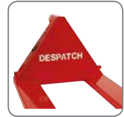
Naam, logo of een andere tekst kan uit de driehoek worden uitgesneden, of u kan kiezen voor een andere kleur.