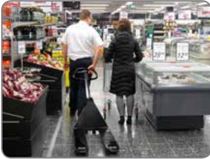
Panther Silent in een supermarkt, waar het comfort en welzijn van de klant primeert.