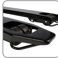
De beugels aan de vorken verzekeren een gemakkelijk in- en uitrijden van paletten.