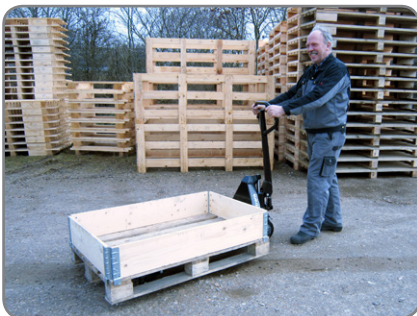
De Panther Silent kan ook buiten werken. Metaalresten, kleine stenen en sneeuw blijven niet aan de wielen kleven.