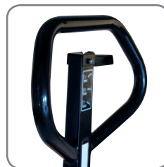
Ergonomisch handvat verzekert een relaxte grip.