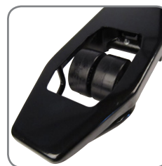
Dubbele wielen voor gemakkelijk veranderen van richting.