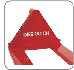
Naam, logo of een andere tekst kan uit de driehoek worden uitgesneden, of u kan kiezen voor een andere kleur.