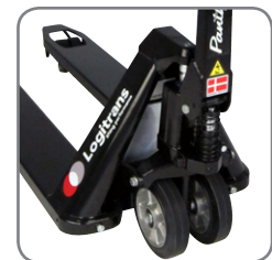
De Panther Silent is voorzien van een permanente quick lift.

Wij bieden eveneens op maat gemaakte oplossingen. Vraag meer informatie, of bezoek www.logitrans.com