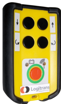
Zender voor draadloze afstandsbediening, RCW 2, voor afstandsbediening in vier richtingen.