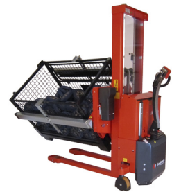
Op de Rotator worden heffen, dalen en draaien door een afstandsbediening met kabel bediend (standard). Draadloze afstandsbediening voor heffen, dalen en draaien verkrijgbaar als optionele extra.