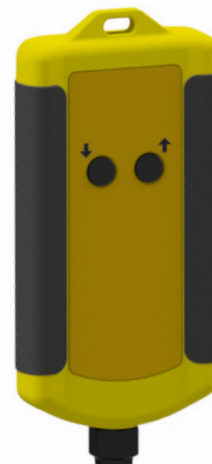
Afstandsbediening met kabel voor toestellen met elektrische hefffunctie (heffen/dalen)