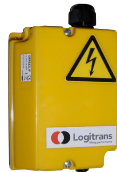
Ontvanger draadloze bediening aan te brengen op toestel.