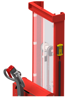
Afstandsbediening met magneet of haak op toestel te hangen.