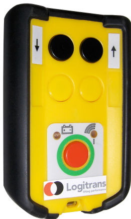
Zender draadloze afstandsbediening, RCW 1, voor afstandsbediening in twee richtingen.