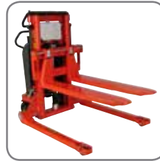
De vorken passen op alle Logiflex modellen met standaard- en spreidstandpoot-basis.

Chisel vorken : dunne vorken voor lage inrij onder de te heffen lading.