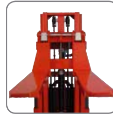
Met het quick shift system, is het gemakkelijk wisselen tussen vorken en optionele extras.