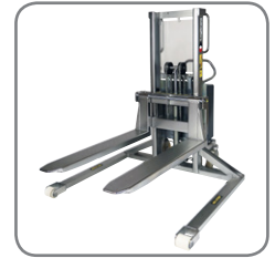
De roestvrije stapelaar met spreidstandpoten kan verschillende paletten aan, ook gesloten paletten.