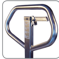
Een relaxte greep dankzij het ergonomisch correcte handvat.