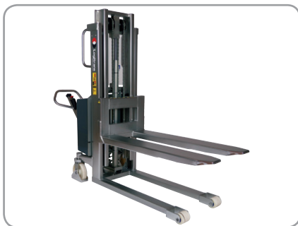
Ook verkrijgbaar met elektrische heffen of explosie beveiligd (manueel model)