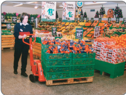
Altura de horquillas regulable: sin problema alguno al manipular palés bajos y desgastados.

También hay disponibles transpaletas de acero inoxidable en versión anti-deflagrante.