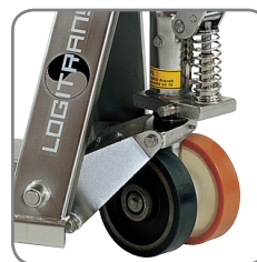
Diferentes tipos de ruedas para dar respuesta a las necesidades del usuario.