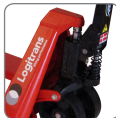
Elevación rápida permanente.