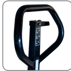
El timón ergonómico garantiza al usuario un agarre relajado. Puede marcarse con el nombre o el departamento.